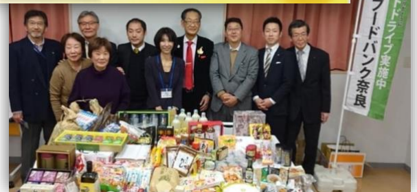
ミモザの家のリーフレット（上）と