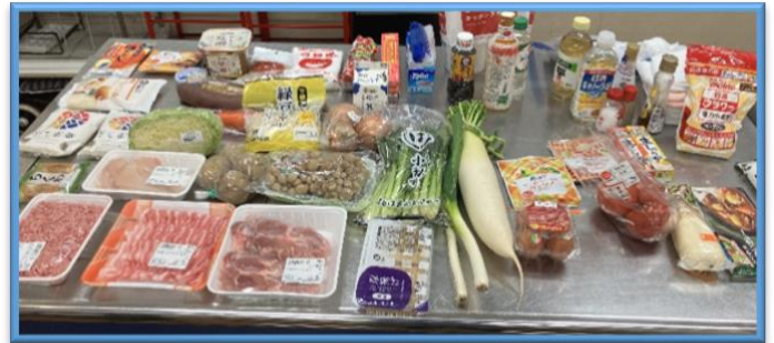
家事支援研修では調理研修もあります。 「この食材を使って、何が作れる？」とわいわい楽しく。 みんなで取り組むことで 発見も多い研修です。