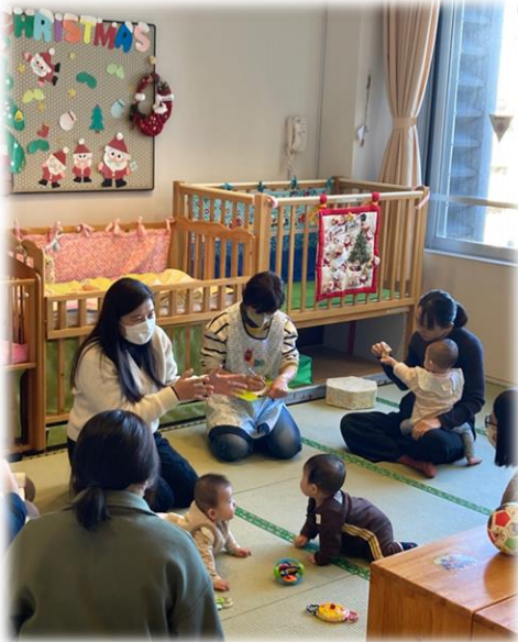
「子育て相談」の様子。お子さんと一緒に 気負わず質問できる雰囲気♪