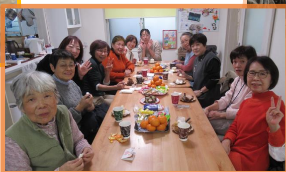
年に1回のサンクスは、 コーヒーとケーキでおいしくたのしく♪