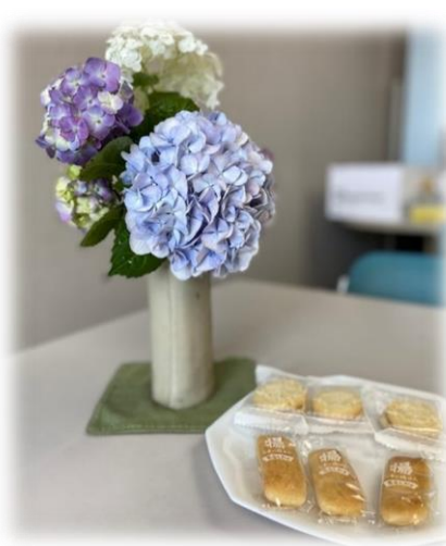
保育者有志の方が、お花を飾ってくださいます。 季節を感じながら、お茶とお菓子で ホッとしてもらえる時間に♪

「楽しかったよー、また入りたいわ」と、笑顔で保育を引き受けてくださる保育者の皆さんの存在はとても心強く、感謝でいっぱいです。これからも、保育者とアドバイザーとママの連携を取りながら、気軽に遊びに来れる場所を続けていけたらと思っています。(アドバイザーS)