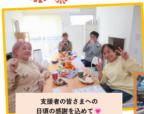
支援者の皆さまへの 日頃の感謝を込めて♡ いつも保育やピッコロへの ご理解・ご協力を ありがとうございます！