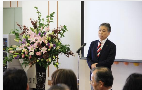
祝辞 清瀬市長 渋谷金太郎さま