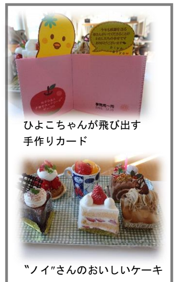
ひよこちゃんが飛び出す手作りカード

事務局の用意した手作りのカードも喜んでいただけました。今回参加できなかった方々は、次にはぜひおいでいただけたら嬉しいです。